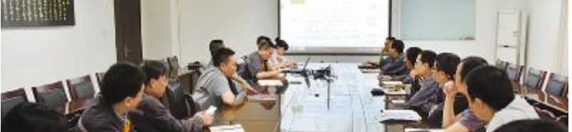
永祥树脂召开降本增效推进会落实“决战120天”