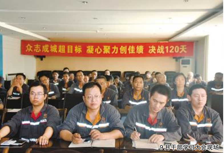
9月干部学习大会现场

本报讯(通讯员 张慧)9月30日下午,永祥股份9月份干部学习大会在永祥多晶硅第六会议室举行。本次干部学习大会由永祥水泥总经理杜炳胜主讲。