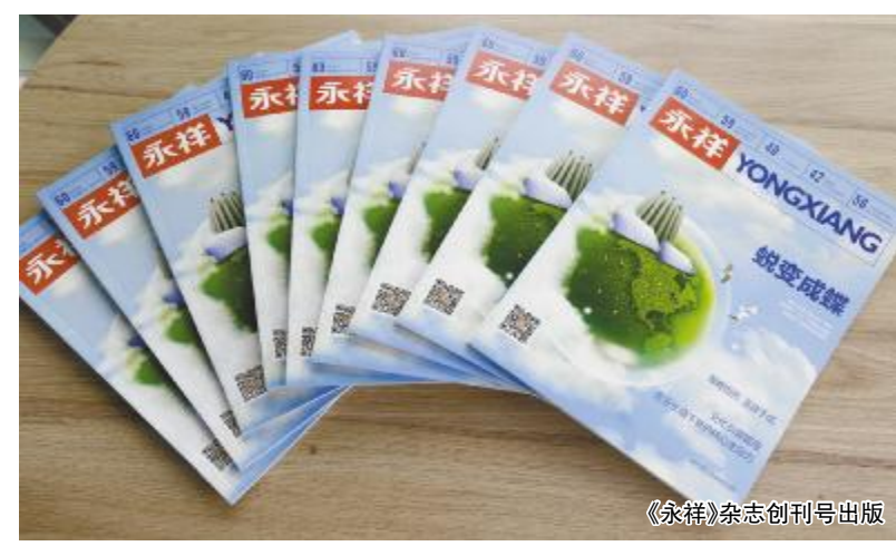
《永祥》杂志创刊号出版

通过对文化融合进行积极探索和有益尝试,《永祥》杂志旨在成为永祥“文化引领管理”的忠实记录者,助推永祥向着打造世界级的多晶硅生产企业和世界级清洁能源公司的宏伟目标不断前进。