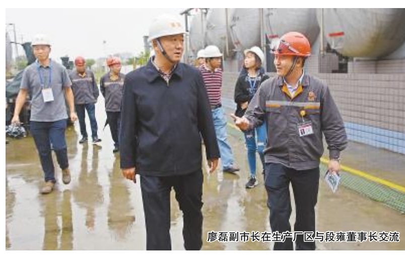
廖磊副市长在生产厂区与段雍董事长交流

通过实地了解和听取介绍,邵区长对永祥股份“提升管理、品质营销、务实创新、行业争先”的经营思路表示充分肯定和赞赏。