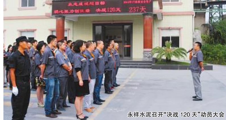
永祥水泥召开“决战120天”动员大会

会上,多晶硅、二、三分厂负责人分别根据各自分厂具体情况进行了目标分解和细化。通过现场分析,更加清晰了目标,制定了更加科学完善的计划。大家信心满满,表示将严格按照计划执行,苦干实干,抓住120天的黄金时间,确保目标任务顺利完成,众志成城,共度难关。