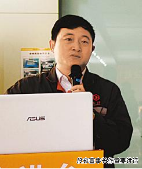
段董董事长作重要讲话