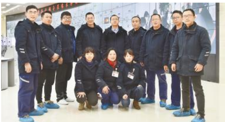
永祥新能源生产部