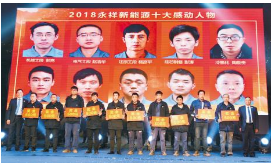
永祥新能源团拜会上，表彰公司十大感动人物