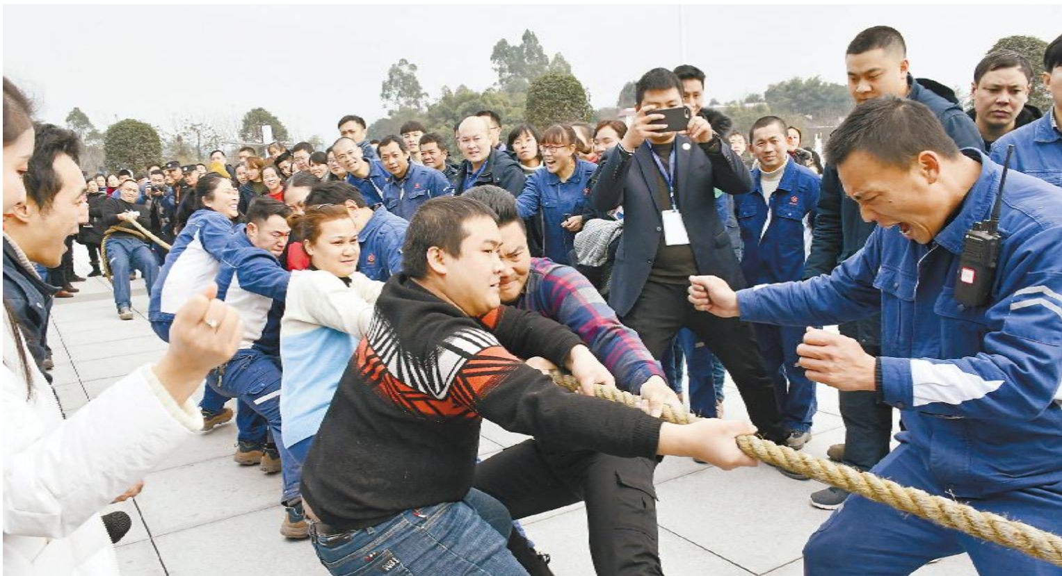
拔河赛比拼团队协作能力

与此同时，近2000公里外的内蒙古通威高纯晶硅同步举办了春节游园趣味游戏活动，精彩的抓瓶子、吹蜡烛等游戏的开展，寓教于乐，更让大家感受到了永祥家庭的温暖。