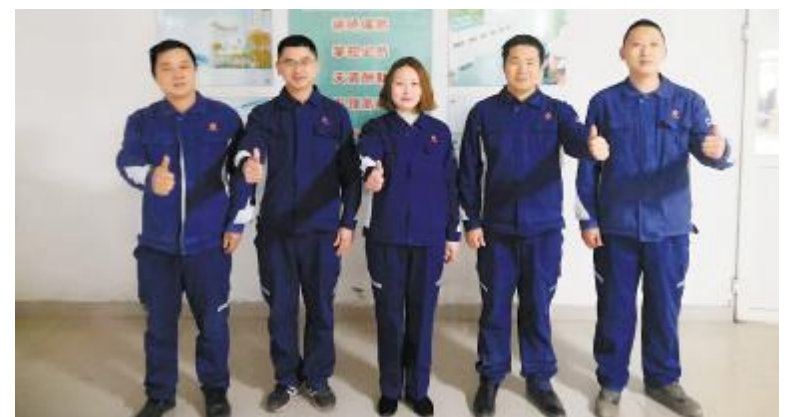
永祥新材料商砼部