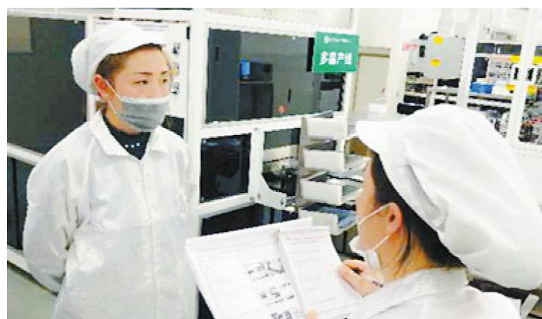
永祥硅材料品管部分选包装2班积极开展“一日三问”行动