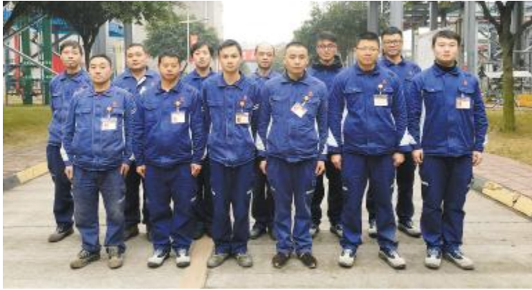
永祥多晶硅生产部 804-5