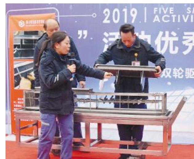
员工现场展示公司的“小发明、小创造”