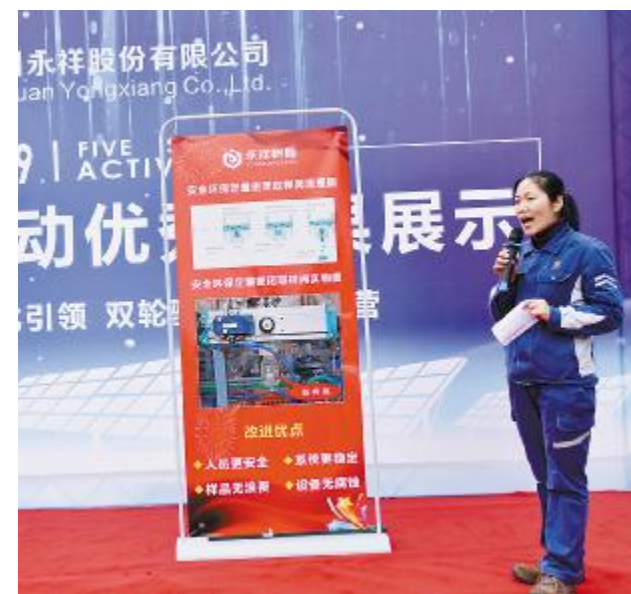
员工讲解公司“五小提案”活动成果