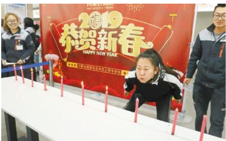
内蒙古通威高纯晶硅同步举行游园活动