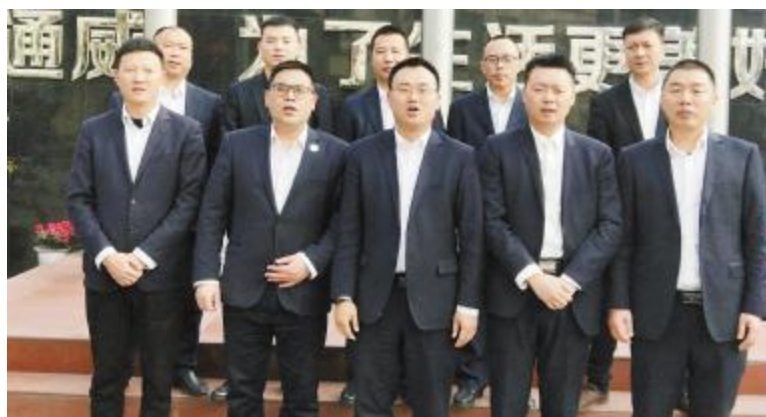
永祥新材料销售部