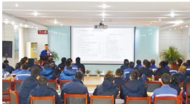
永祥多晶硅召开经营方针落实会,明确2019年目标

根据检测,硅芯炉出炉硅芯情况良好,每台炉每天的产量以及硅芯合格率都达到调试期的生产目标,满足调试期间硅芯供应要求。在建设过程中,805B硅芯制备大厅积极创新,安装调试速度远超同行建设水平。公司员工学以致用,通过在设备安全安装调试中不断的实操练习,并与内蒙古通威高纯硅、永祥多晶硅同事相互学习探讨交流,操作技能持续提升。特别是在春节期间,工段员工连续奋战在生产一线,确保了各项工作的稳步推进。