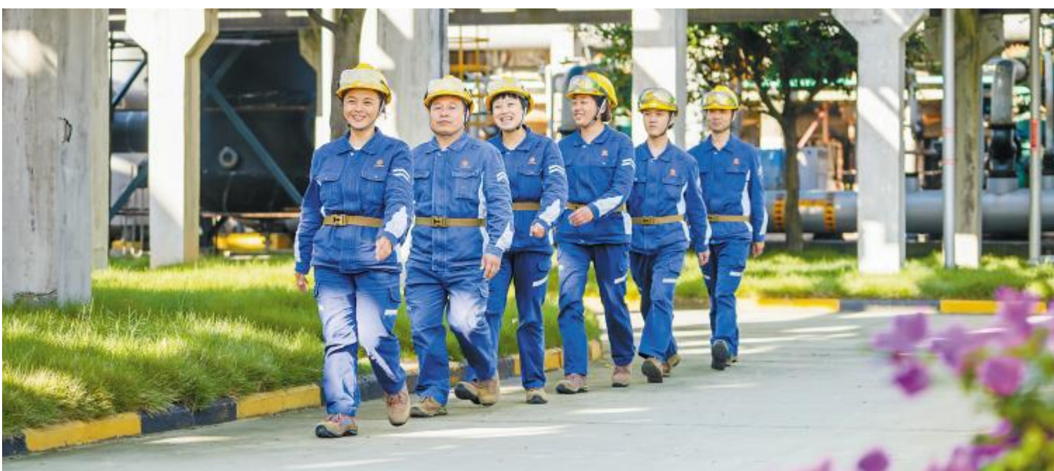
永祥树脂全力营造安全、绿色的厂区氛围

学习会后,各部门员工纷纷表示,2019年将积极践行“科技创新、文化引领;双轮驱动、高效经营”管理思路,把“123”行动计划2.0版各项措施做精做细,为确保“012”挑战目标的实现,努力干、踏实干、创新干,以崭新的精神面貌、更高的工作标准和工匠精神迎接挑战,勇往直前。