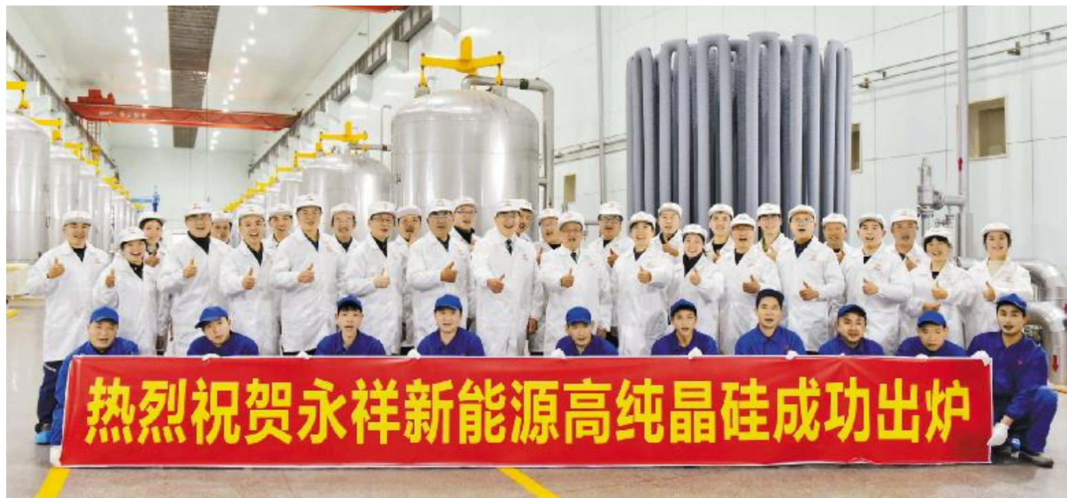
2月12日,永祥新能源高纯晶硅正品成功出炉

永祥股份包头、乐山两地高纯晶硅项目自2018年全部建成投产后,一直在加紧调试、不断完善,力争早日实现达标、达产的目标。继2018年底内蒙古通威高纯晶硅正品成功出炉后,今年2月,永祥新能源传来喜讯,首炉高纯晶硅正品成功出炉,自此,永祥两地高纯晶硅项目均实现了正品成功出炉,标志永祥迎来发展里程碑,向着全面达标达产,实现高纯晶硅“中国制造”迈出了坚实的一步。