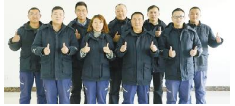
永祥股份本部管理提升小组