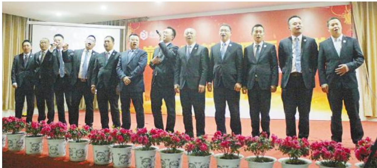
永祥新材料团拜会上，全体管理人员大合唱《明天会更好》