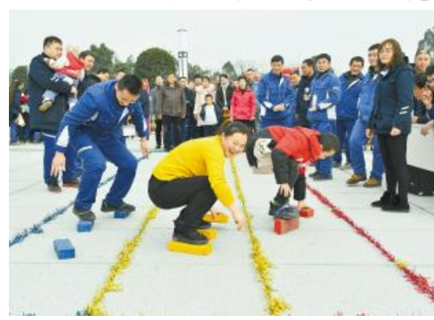
员工及家属积极参与到游园活动中