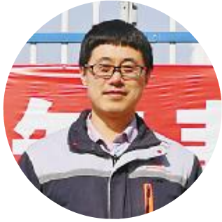
内蒙古通威高纯晶硅孔祥晨