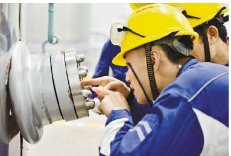
永祥新能源员工密切关注设备运行情况