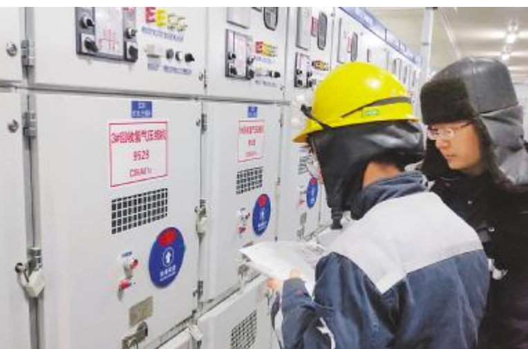
内蒙古通威高纯硅员工严控细节确保安全生产