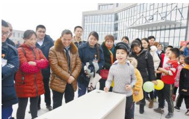
趣味游戏让员工家属参与其中