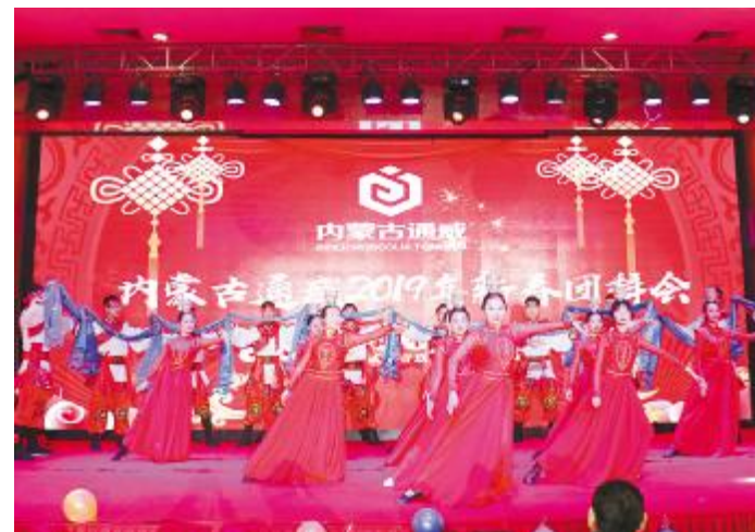
内蒙古通威高纯晶硅团拜会上，地方特色的歌舞表演让员工大饱眼福