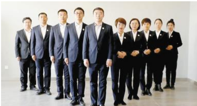
内蒙古通威高纯晶硅人事行政部