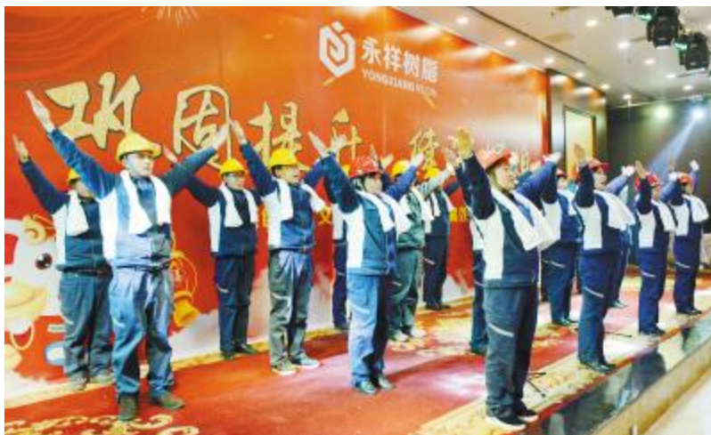
永祥树脂团拜会上，员工带来表演《咱们永祥有力量》