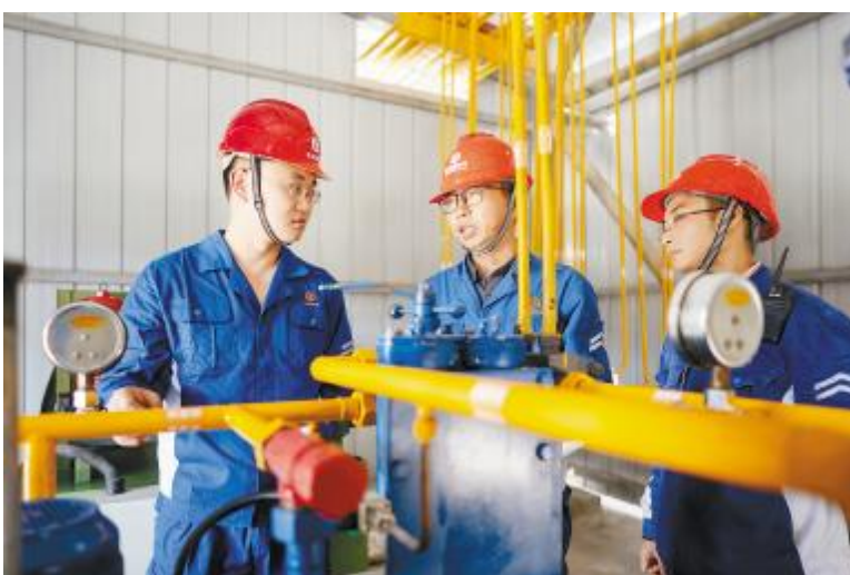
永祥新材料干部员工在工作中对标挖潜