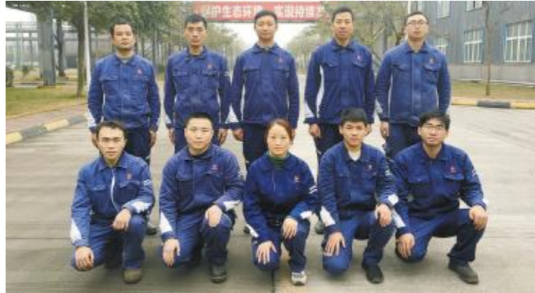
永祥多晶硅设备动力部仪表工段