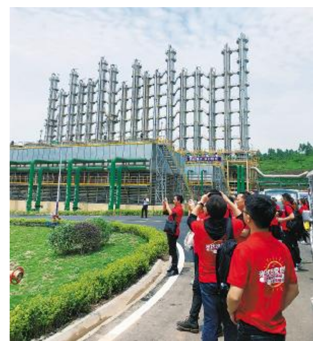
主流媒体走进永祥,聚焦永祥绿色发展