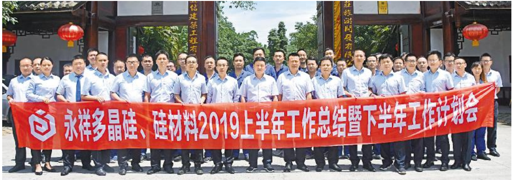
永祥多晶硅、硅材料 2019 年上半年工作总结会合影留念