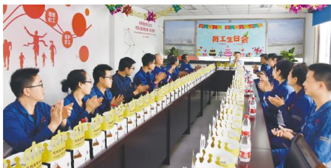
和谐型班组 公司开展员工生日会活动 永祥多晶硅