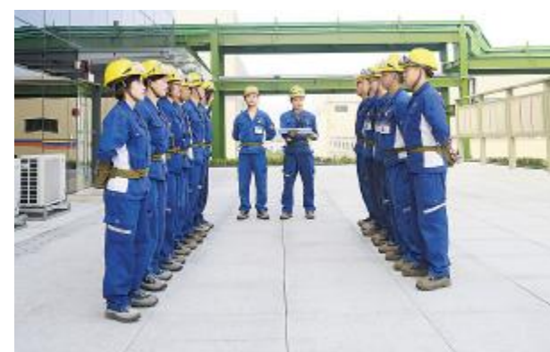
标准化交接班仪式

2019年上半年,永祥股份集采中心多措并举,进一步实现了价值采购和降本增效,与经营计划价格比,节约采购预算1850万元(含税)。剔除市场因素,完成价值采购降本增效2955.14万元(不含税)。成功引入多家优质战略供应商,为下半年任务目标实现,奠定坚实基础。