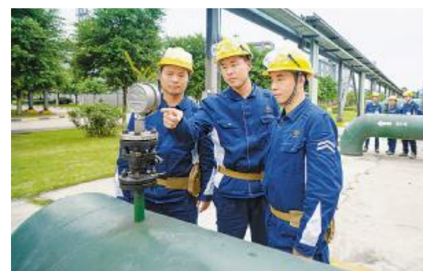
员工对生产细节精益求精