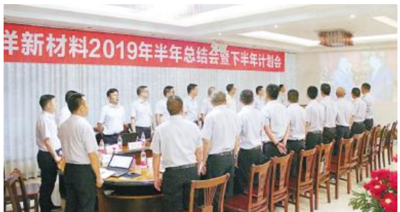
永祥新材料 2019 年上半年总结会上,参会干部员工齐唱通威之歌