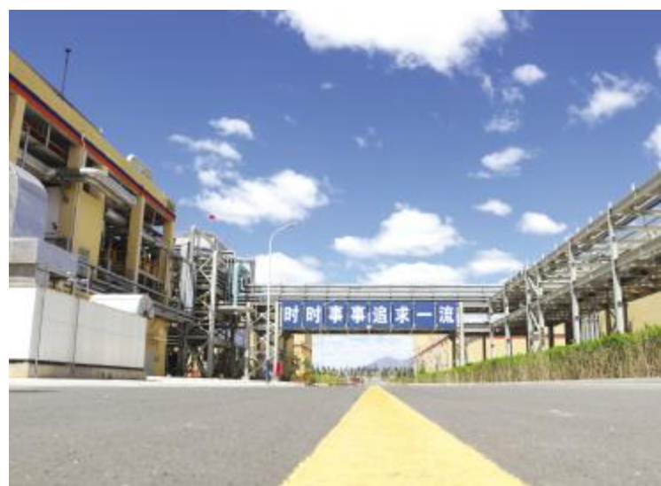
整洁的内蒙古通威高纯晶硅厂区