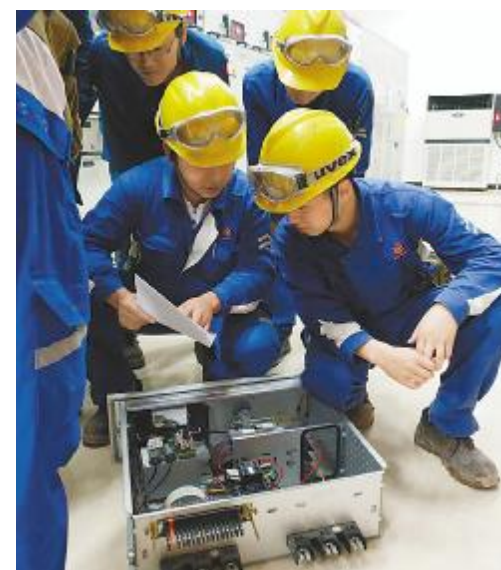
技能型班组 班组结合实际,注重实操,开展低压电气岗位技能提升培训 永祥新能源

自2017年9月,永祥股份启动班组建设以来,班组建设深入永祥各公司、各工段,形成永祥文化特色,为企业提升、阿米巴探索增添了新动能。2019年,班组建设持续推进,并结合永祥新一轮管理提升、清单管理切实落实到生产一线,取得不错成绩,“技能型班组”、“和谐型班组”、“创新型班组”不断涌现,成为各公司快速发展的有力支撑。