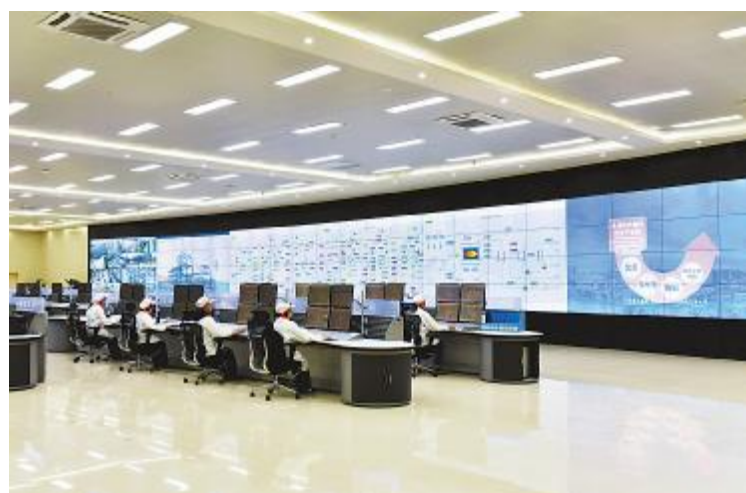
先进的永祥新能源中控大厅

7月26-27日,永祥股份2019年半年总结会成功举行。会议对永祥股份及各子公司2019年上半年工作进行总结,对下半年工作开展进行安排部署。上半年,永祥股份及各子公司继续保持着高昂的工作状态,持续推进科技创新、管理提升、清单管理、降本增效、价值采购、阿米巴经营、班组建设等方面工作,取得良好成绩,一串串数据背后,是全体永祥干部员工的不懈努力和辛勤的付出;一串串数据展示的是,永祥向着打造世界级高纯晶硅龙头企业,建设世界级晶硅生产安全标准迈出的坚定步伐。