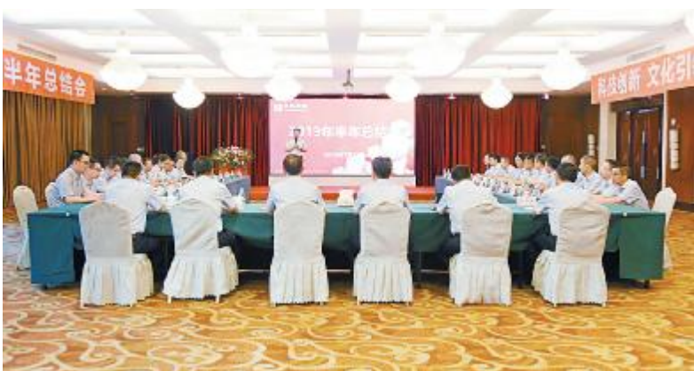
永祥树脂 2019 年半年总结会成功举行