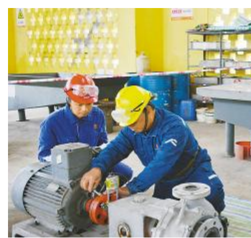
技能型班组 公司开展班组技能考试,考核员工根据清单进行操作 永祥树脂