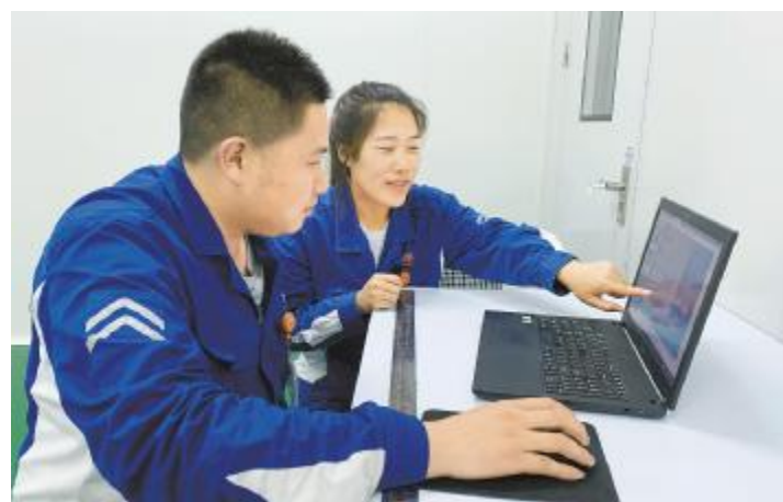
创新型班组 员工就操作标准升级进行现场讨论 内蒙古通威高纯晶硅