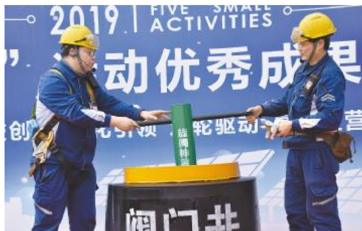
创新型班组 员工展示自制的阀门井旋阀神器 永祥多晶硅