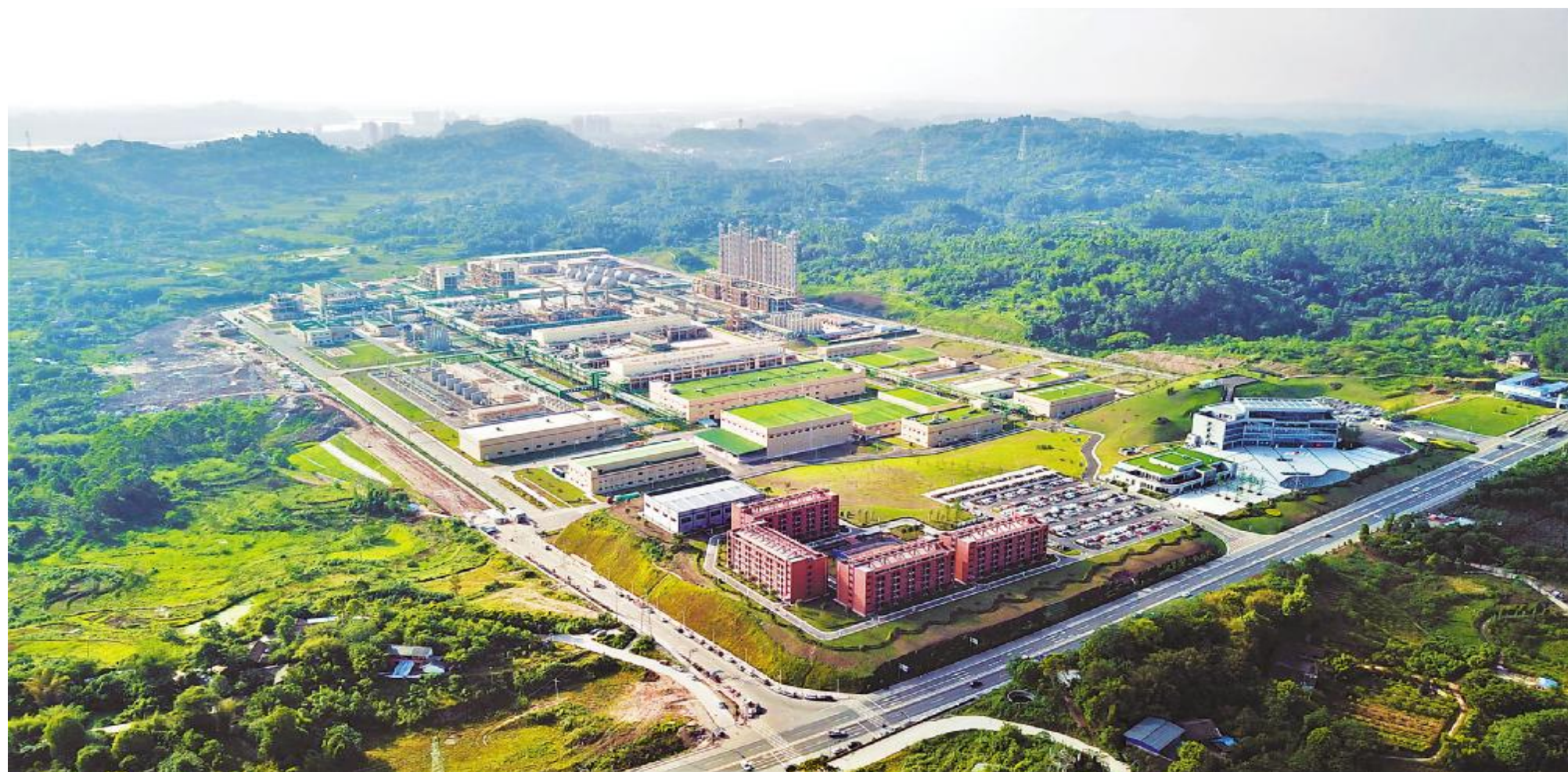
永祥新能源绿色厂区

7月26-27日,永祥股份2019年半年总结会成功举行。会议对永祥股份及各子公司2019年上半年工作进行总结,对下半年工作开展进行安排部署。上半年,永祥股份及各子公司继续保持着高昂的工作状态,持续推进科技创新、管理提升、清单管理、降本增效、价值采购、阿米巴经营、班组建设等方面工作,取得良好成绩,一串串数据背后,是全体永祥干部员工的不懈努力和辛勤的付出;一串串数据展示的是,永祥向着打造世界级高纯晶硅龙头企业,建设世界级晶硅生产安全标准迈出的坚定步伐。