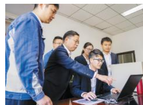
永祥股份财务中心员工讨论分析数据

展望未来,袁总相信财务部门将在公司发展中扮演更重要的角色。“未来,财务将进一步从提效率角度出发,支撑公司发展。”袁总表示,财务部门将通过数据传导,让公司战略和员工行为有效结合,并高效运行。“让每个员工都知道公司的目标,然后通过数据展示出每一个员工创造的价值,每一个部门的贡献,还有哪些方面的潜力可以挖掘,然后如何实现公司目标。”在袁总看来,在行业里不能将竞争力做到第一,是没法“活下去,活得好”。而第一不仅靠量,还要靠质,这个质除了是产品质量就是企业自身管理质量、管理效率。财务部门也将通过财务引导,来帮助公司做到质上的第一。“刘汉元主席曾说过:行业有周期,春夏秋冬始终会循环,但是自己的问题解决了,永远是冬天。在我看来,公司练好内功,在质、量上都做到最好,即使面临行业寒冬,也不用担心。”