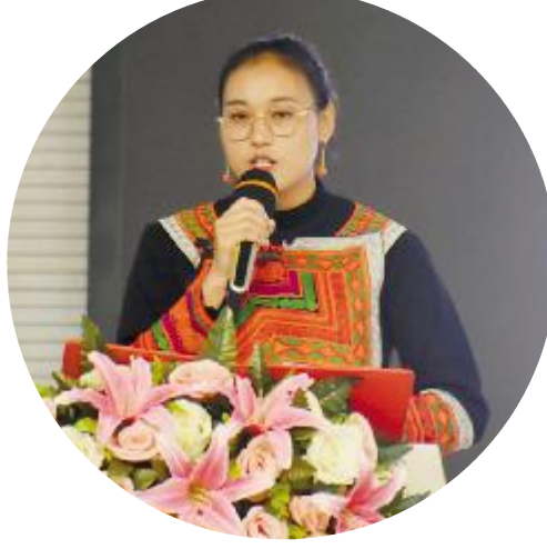
员工身着民族服饰参加比赛