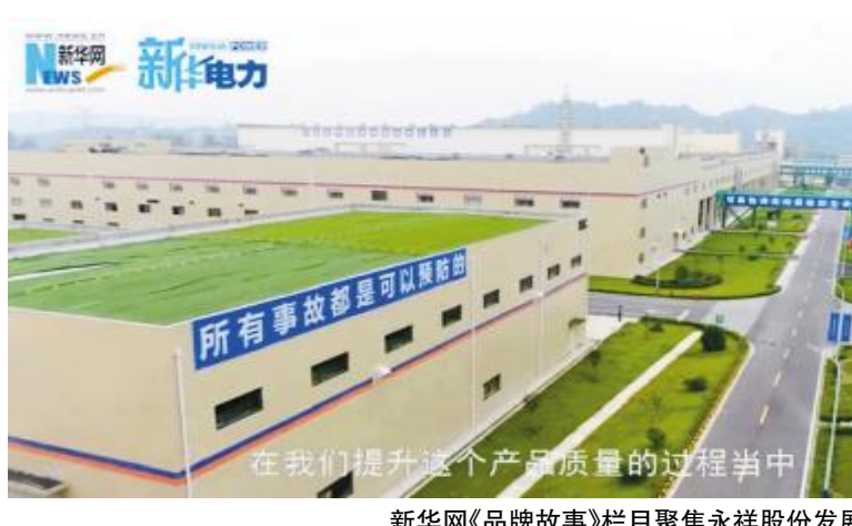
新华网《品牌故事》栏目聚焦永祥股份发展

长期以来,永祥始终坚持绿色环保高质量发展,致力于不断提升产品品质,把产品做到极致,为打造高纯晶硅的世界级龙头企业和世界级清洁能源公司不懈努力,并多次受到中央电视台、新华社、新华网、《人民日报》、人民网、《中国环境报》《环境经济》《环境保护》等主流媒体聚焦关注,此次获新华网《品牌故事》栏目专题聚焦再次彰显了永祥的品牌影响及强劲的发展实力。