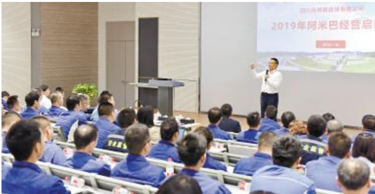
永祥新能源成功召开阿米巴工作启动会