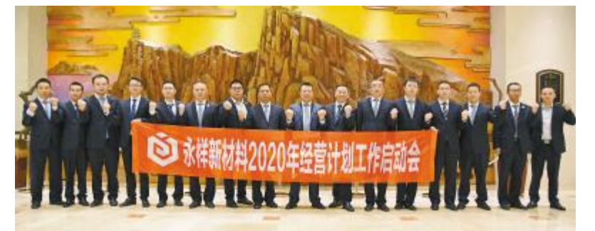
永祥新材料2020年经营计划工作启动会成功举行