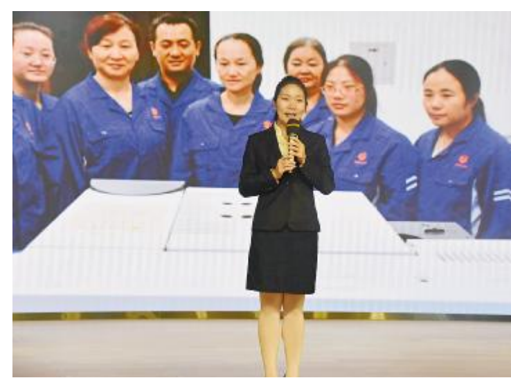
参赛选手通过图片展示班组风采