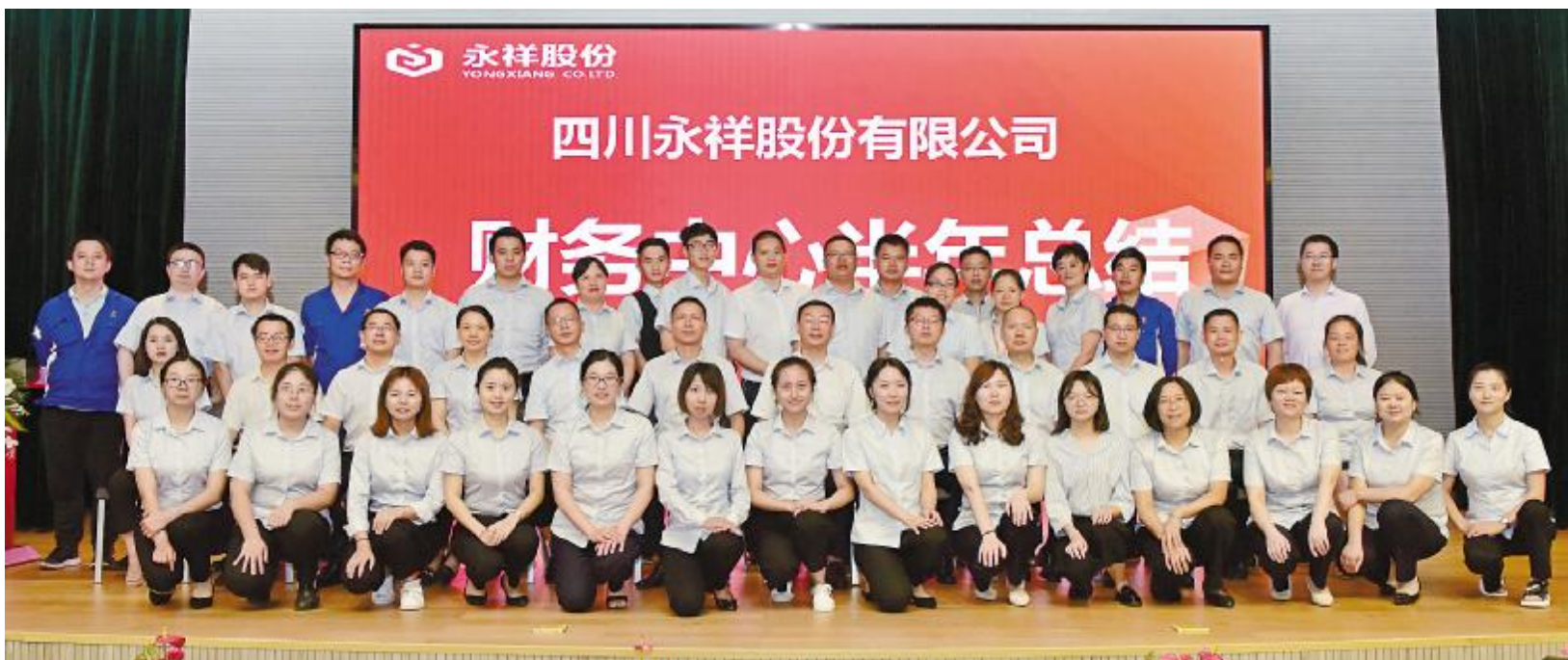
永祥股份财务体系团队