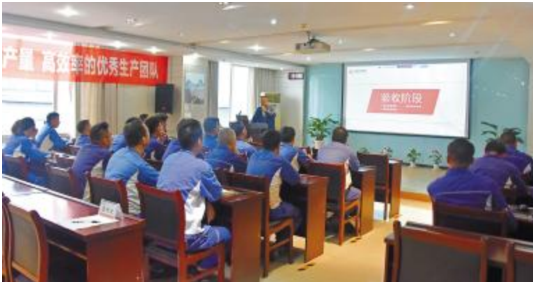
永祥多晶硅“设备双四管理”总结会成功举行