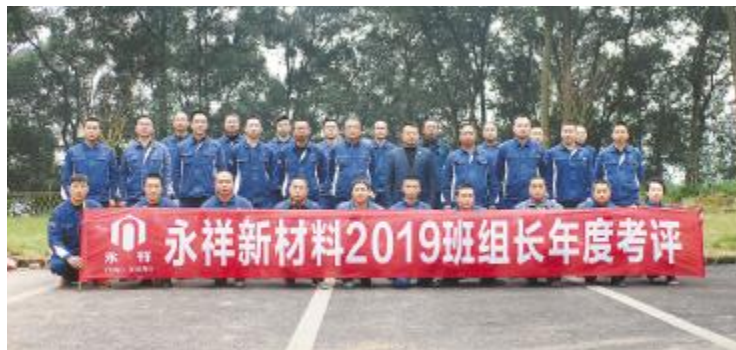
永祥新材料2019年度班组长测评合影