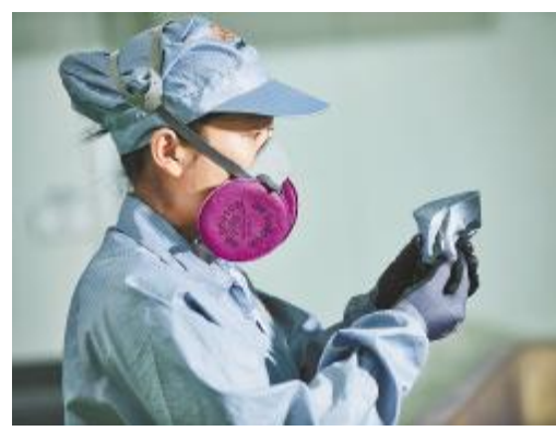
2019年永祥单晶占比大幅提升