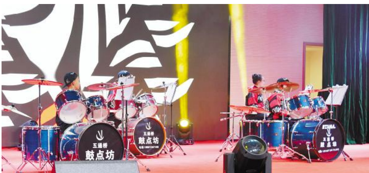
“永祥二代”的架子鼓表演精彩亮相