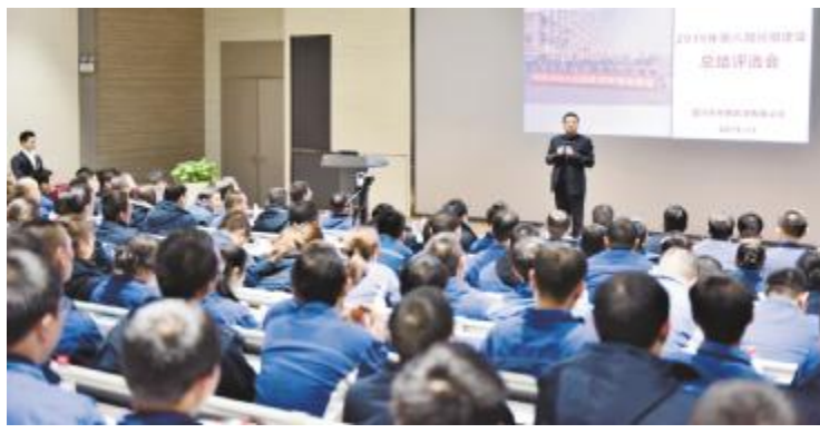
永祥新能源开展红旗班组长评选活动