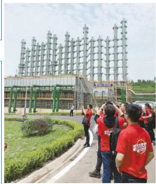
2019年5月,新华社、人民网、中央电视台、凤凰网等百家主流媒体走进永祥参观