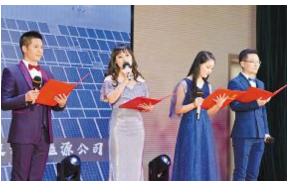
永祥股份员工带来感人肺腑的诗歌朗诵表演