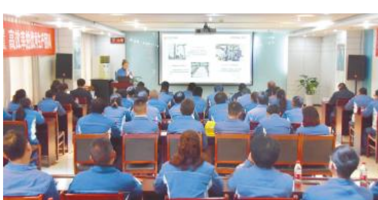
永祥多晶硅举行2019年度红旗班组长PK大赛