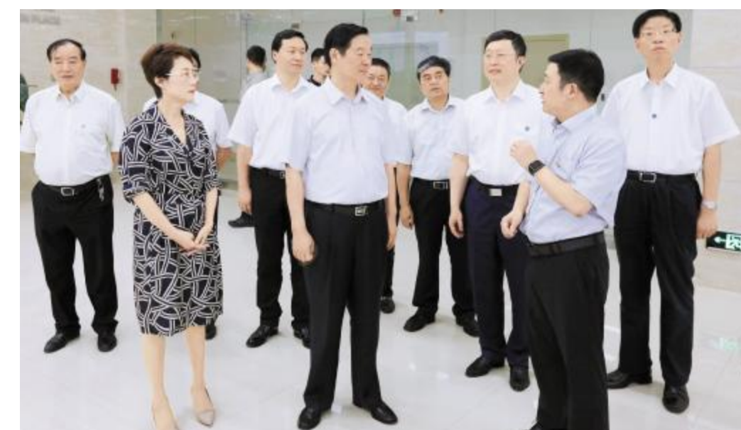
2019年7月,全国政协副主席刘奇葆莅临永祥股份调研,并鼓励永祥为国家和社会经济的高质量发展作出更大贡献

2019年,永祥股份首开封闭式集训之先河,先后启动班长和工段长综合素质提升计划。班组长是班组生产管理的直接指挥和组织者,也是公司中最基层的负责人,生产经营战线冲锋陷阵的生力军。班组长综合素质培训,提高了班组长自主管理意识和能力,进一步夯实了公司发展基础。工段长是重要生产管理人员,通过阿米巴经营管理和综合素质集训打造,进一步将工段长培养成为懂经营、会管理、能用数据说话的管理干部,为成就世界级高纯晶硅龙头企业储备了管理人才和技术人才队伍。