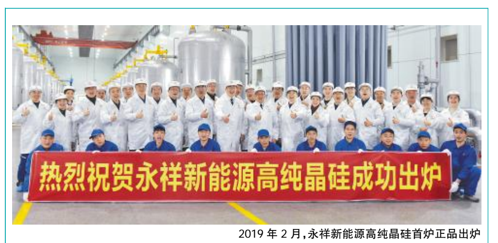
2019年2月,永祥新能源高纯晶硅首炉正品出炉

12月31日晚,永祥股份“激情铸梦,再创辉煌”迎新晚会上,公司分别对32名来自内蒙古通威高纯晶硅和永祥新能源的“工程建设暨达标达产杰出贡献者”进行了隆重表彰,并通过丰富多彩的文艺节目展现了永祥人团结协作、积极向上的风采,表达了对不畏艰辛、砥砺奋进的永祥英雄的崇高敬意。