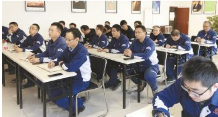
永祥树脂材料组织开展“管理者的角色定位”主题学习活动