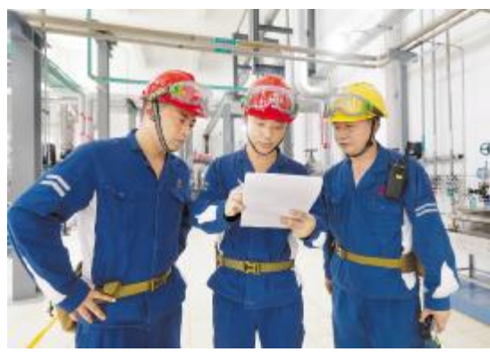
永祥员工在工作中广泛运用“清单管理”