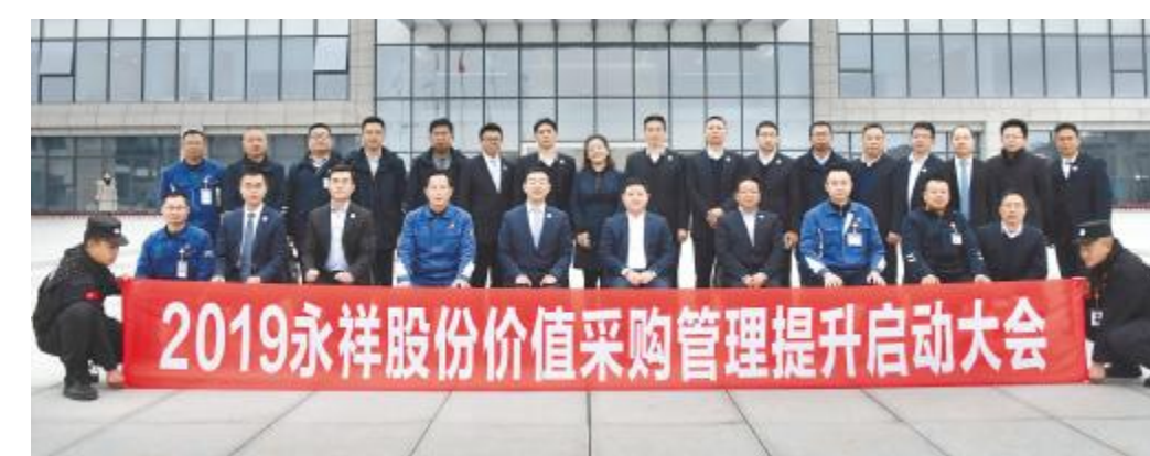
2019年2月,永祥股份启动价值采购管理提升